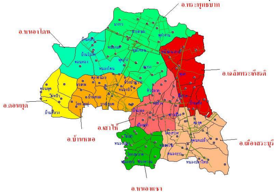
แผนที่แสดงเขตพื้นที่การศึกษาประถมศึกษาสระบุรี เขต ๑

สำนักงานเขตพื้นที่การศึกษาประถมศึกษาสระบุรี เขต ๑ ตั้งอยู่ถนนมิตรภาพ ตำบลปากเพรียว อำเภอเมือง จังหวัดสระบุรี มีพื้นที่รับผิดชอบ ๘ อำเภอ ประกอบด้วย อำเภอเมืองสระบุรี อำเภอเฉลิมพระเกียรติ อำเภอบ้านหมอ อำเภอหนองโดน อำเภอดอนพุด อำเภอพระพุทธบาท อำเภอเสาไห้ และอำเภอหนองแซง อำเภอเมืองสระบุรีตั้งอยู่ทางตอนกลาง ค่อนไปทางทิศตะวันตกเฉียงใต้ของจังหวัด การติดต่อกับจังหวัดใช้เส้นทางหลวงแผ่นดินหมายเลข 2 (ถนนมิตรภาพ) พิกัดภูมิศาสตร์: 14°31'38"N 100°54'35"E