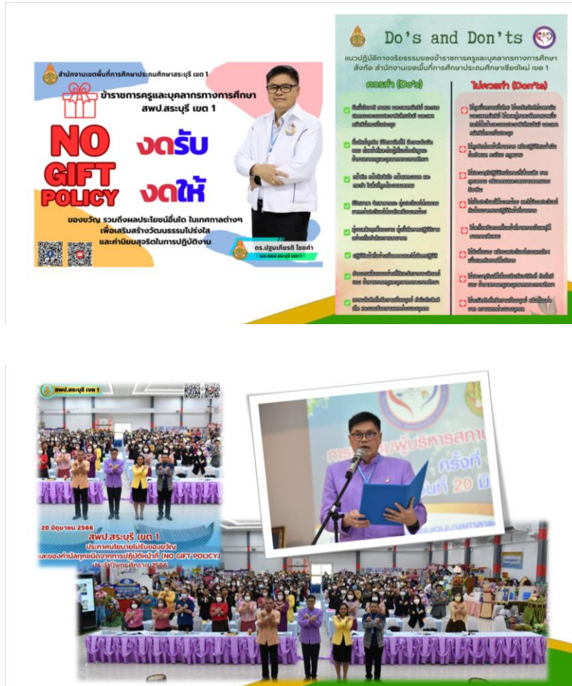
การสร้างการรับรู้ และสร้างจิตสำนึกสาธารณะสำนักงานเขตพื้นที่การศึกษาร่วมขับเคลื่อนไทย ให้ใสสะอาด ปราศจากการทุจริต (Zero Tolerance & Clean Thailand)